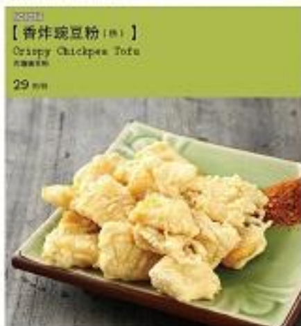
【香炸豌豆粉】 Crispy Chickpea Tofu 29元