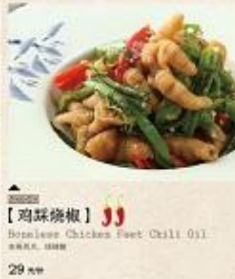
【鸡踩烧椒】 Boneless Chicken Feet Chili Oil 29元