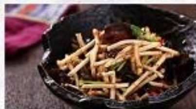
凉菜 【西山清心折耳根】 Yunnan Herb Root Spicy Salad 凉菜、折耳根