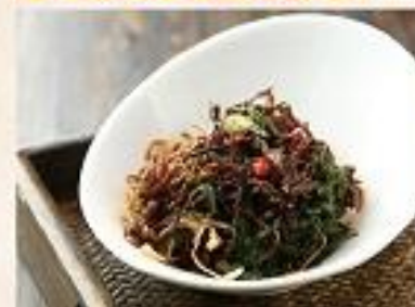
凉菜 【珊瑚菌拌野菜】 Wild Vegetables with Coral Fungi Spicy Salad 凉菜、珊瑚菌