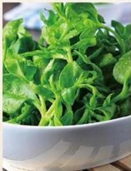
【蒜泥洋瓜尖】 Stir-Fried Buddha-hand Melon Shoots with Garlic ¥36