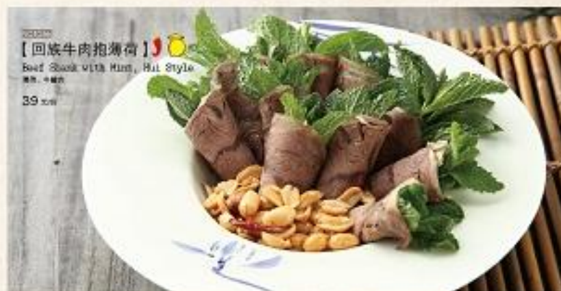
【回族牛肉抱薄荷】 Beef Shank with Mint, Hui Style 39元