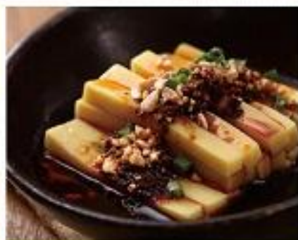
【昆明豌豆粉】 Chickpea Tofu with Tasty Sauce 20元

All pictures in this Menu are for reference only.