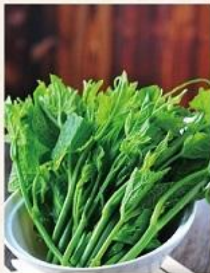
【干椒洋瓜尖】 Stir-Fried Buddha-hand Melon Shoots with Dried Chili ¥36