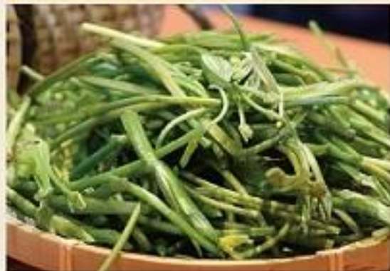
【水性杨花—泸沽湖鬼菜】 (干椒炒) Stir-Fried Lotus Lake Water Pans Flower With Dried Chili ¥39 ¥36