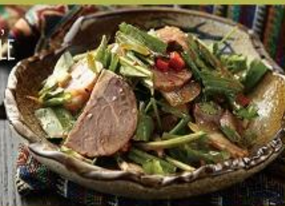
凉菜 【麻栗坡香菜拌牛肉】 Beef and Coriander Spicy Salad 凉菜、麻栗坡牛肉、香菜