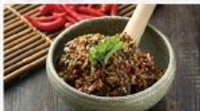
凉菜 【手撕茄子】 Eggplant with Peppers 凉菜、茄子