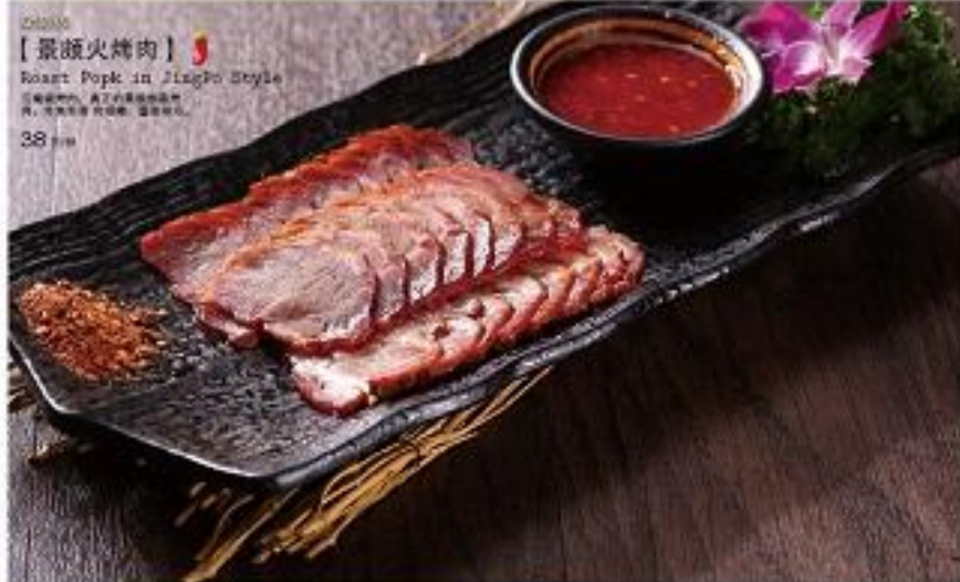
【景颇火烤肉】 Roast Pork in JingPo Style 38元