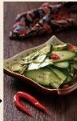
【景洪傣味黄瓜】 Dai Cucumber Spicy Salad 19元