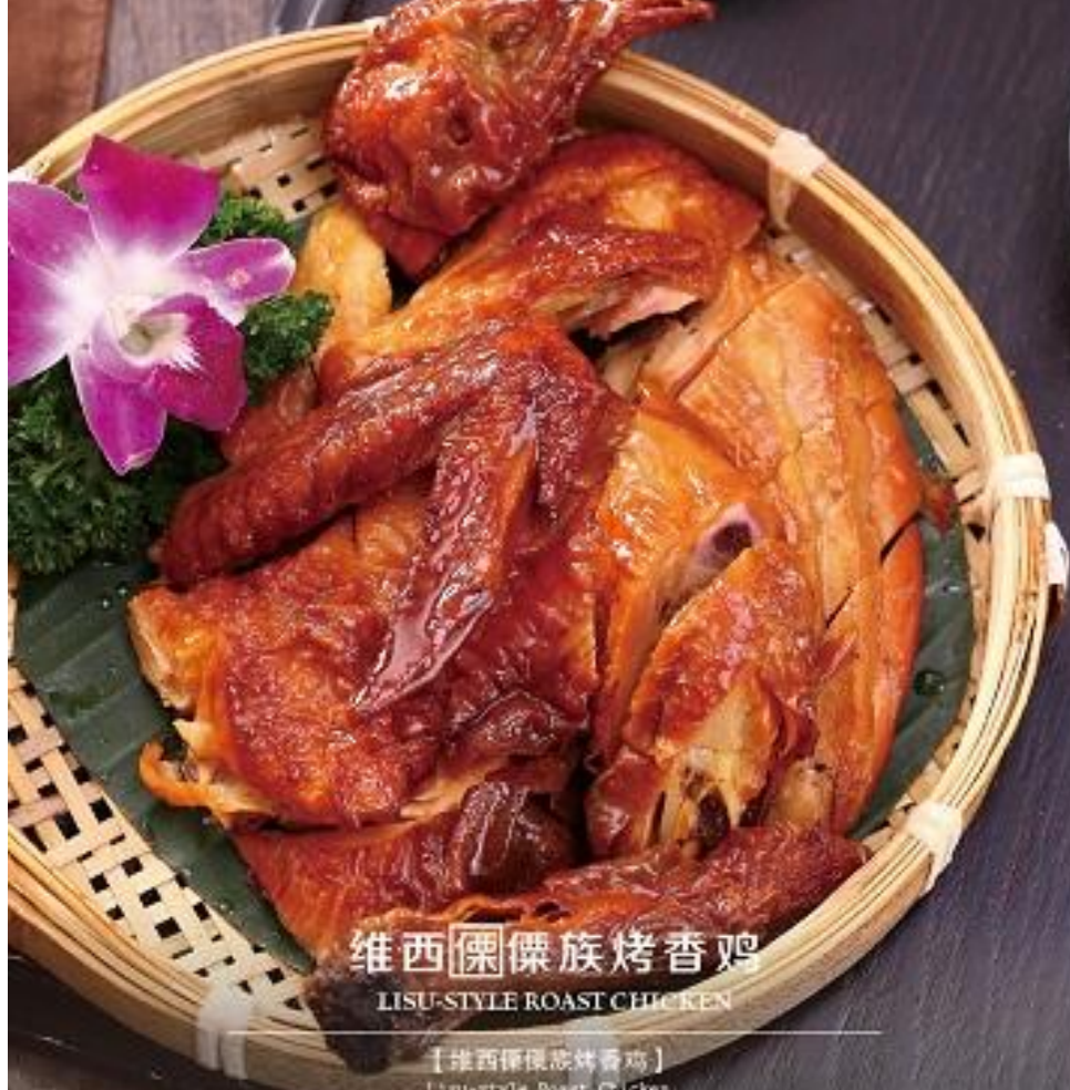
维西傣族烤香鸡 LISU-STYLE ROAST CHICKEN