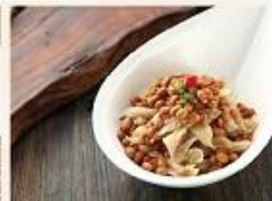
凉菜 【爽口鸭划水鸭】 Duck Web with Fermented Soy Beans and Onion 凉菜、鸭划水、葱