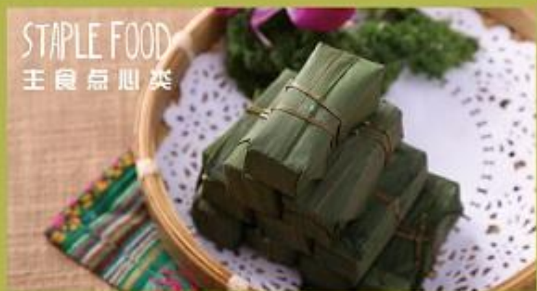
【 戴家泼水粳粑 】 Dai Sticky Purple Rice