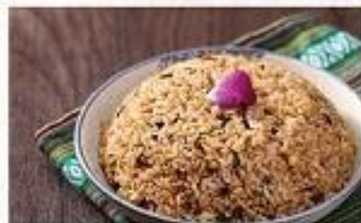
【 野生菌菇炒饭 】 Fried Rice with Wild Mushrooms