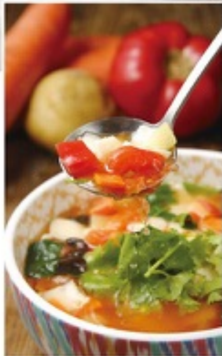
揪片子汤面 NOODLES IN SOUP WITH LAMB & TOMATO 手工面、羊肉、西红柿 Noodles, Lamb, Tomato