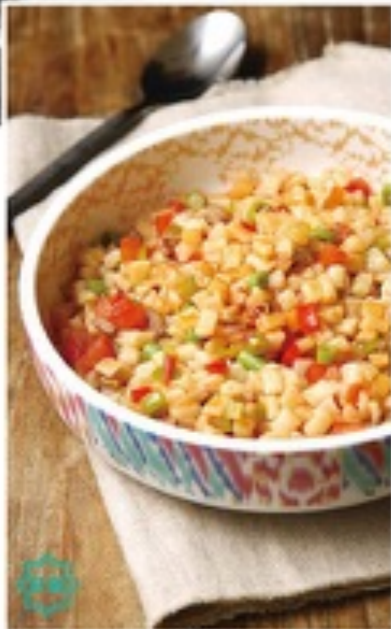
丁丁炒面 FRIED NOODLE DICES 手工面、羊肉、洋葱、西红柿 Noodles, Lamb, Onion, CHS