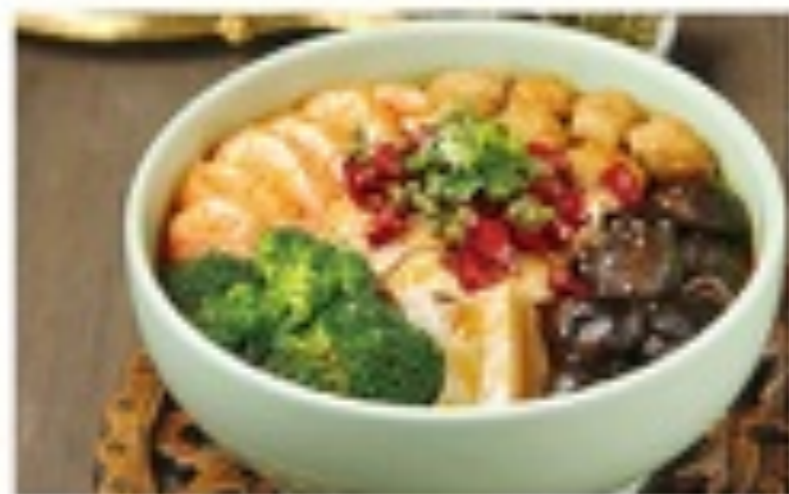
西域热盘景 69 RMB BRAISED ASSORTED DELICACIES IN SOUP

川、粤、京 Szechuan, Cantonese, Beijing 四川—成都辣子鸡, 粤式—豉汁辣子鸡, 北京—北京辣子鸡