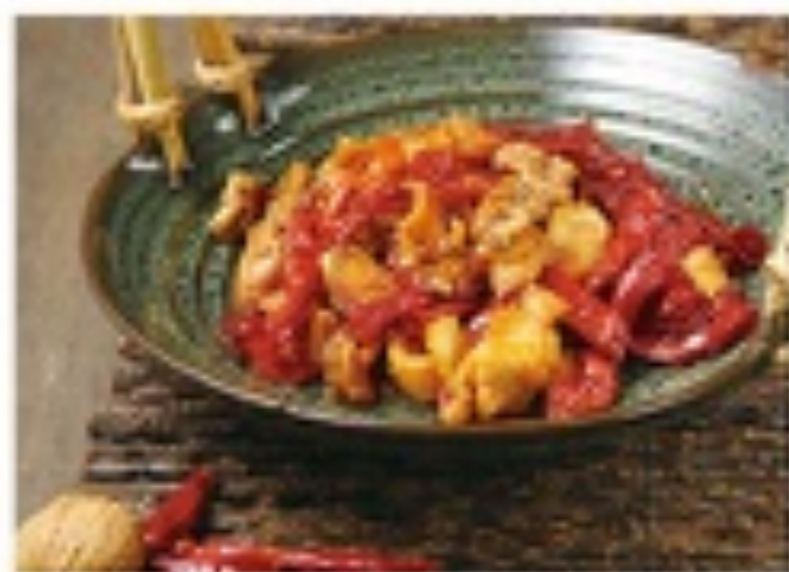
煲窝糖辣子鸡 69 RMB STEWED CHICKEN WITH CHILI

川、粤、京 Szechuan, Cantonese, Beijing 四川—成都辣子鸡, 粤式—豉汁辣子鸡, 北京—北京辣子鸡