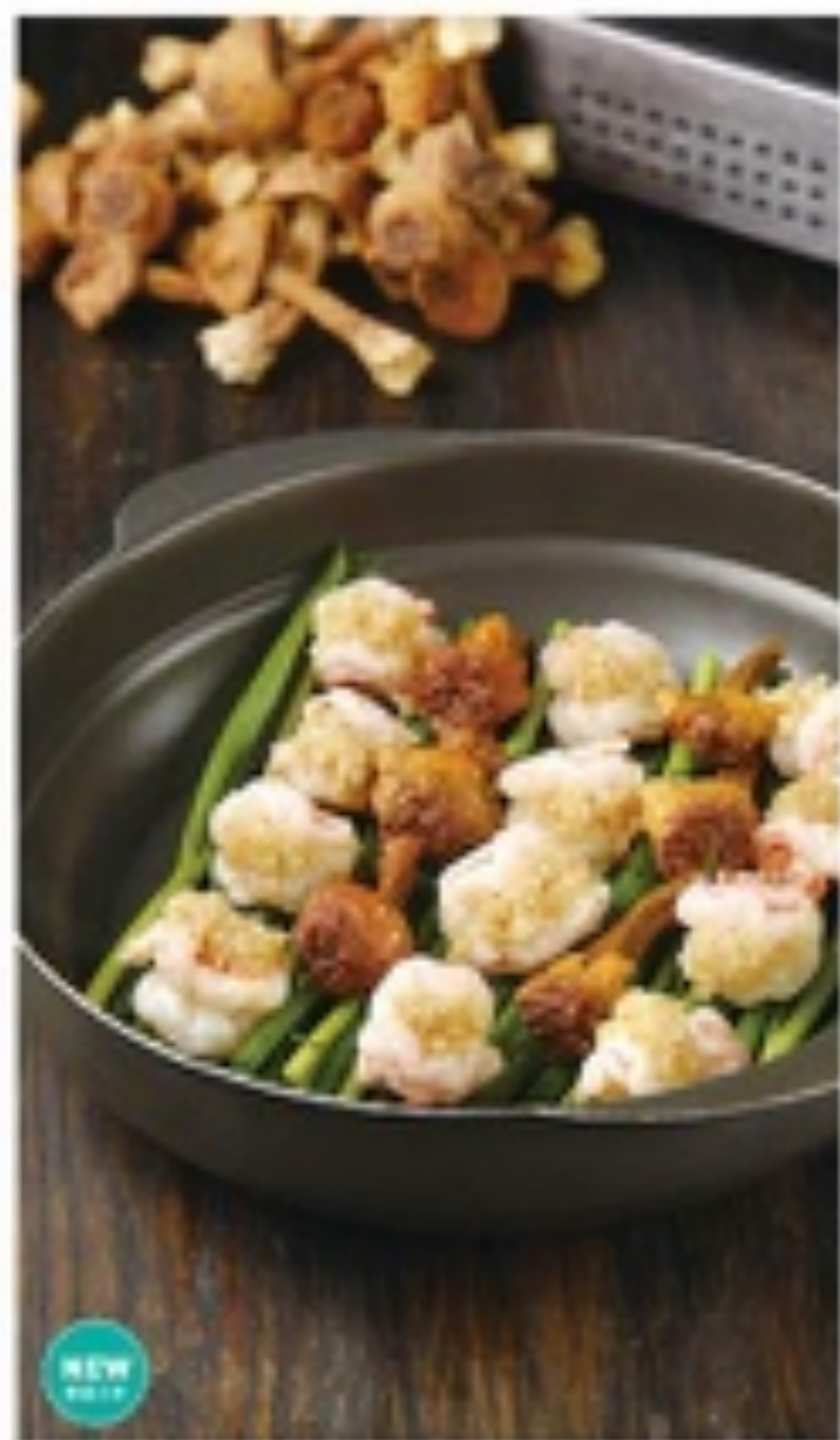
草原菌菇焖虾 69 RMB STEAMED SHRIMP WITH MUSHROOM